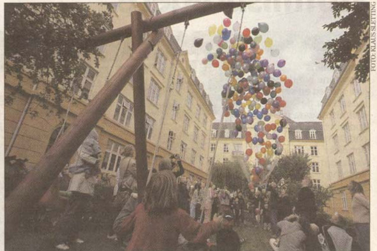
Mere end 200 balloner blev sendt til vejrs til ære for fødselaren.